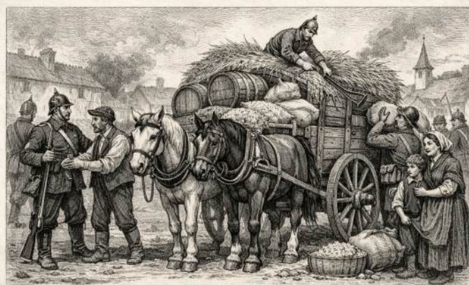
— Charrette réquisitionnée en 1870 —

Finalement à la fin de la guerre la commune de Zinswiller reçut en tout et pour tout une somme globale de 8000.- Mark à distribuer aux gens ayant subis des réquisitions.